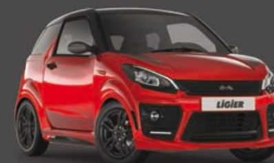
Rojo Toledo Metalizado