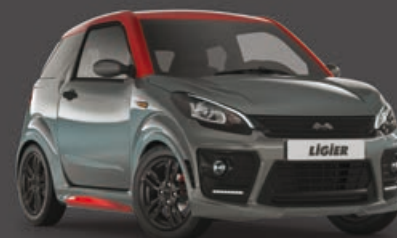
Gris Grafito Metalizado