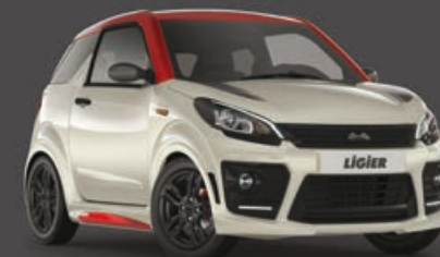
Blanco Nacarado Metalizado